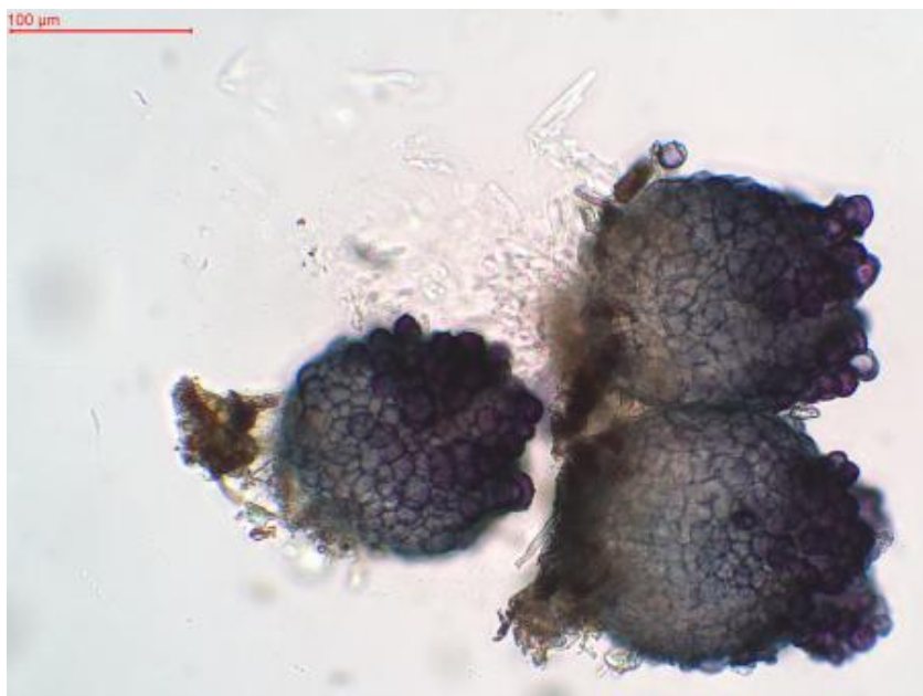
Obr. 1 Perithecia Fusarium graminearum na posklizňových zbytcích kukuřice (22.5.2026)

Monitoring byl zaměřen nejen na výskyt perithecií Fusarium graminearum , ale také na jejich zralost ve vztahu k růstovým fázím obilnin. Pro rozvoj fuzarióz klasů je zásadní, aby se období uvolňování askospor časově překrývalo s kvetením obilnin, kdy jsou klasy nejcitlivější k infekci. Sledování tohoto časového souběhu umožňuje lépe odhadnout aktuální infekční tlak patogenu a podpořit správné načasování fungicidních aplikací.